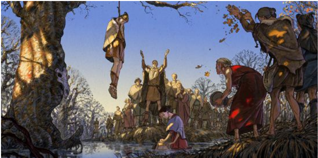
De Tollund man wordt opgehangen als offer aan Moeder Aarde

De Tollundman werd dus als offer aan de aardgodin opgehangen. Toen werd het touw met een mes doorgesneden, en zijn ogen gesloten. De man werd in foetushouding gelegd en naar het veen getild. Daar werd hij neergelegd. Na een tijdje steeg het water en verdween het offer onder het veen, om duizenden jaren later gevonden te worden door turfstekers.