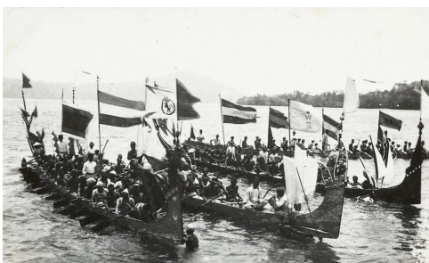
Molukse KNIL soldaten bij aankomst op Celebes. Zij vechten onder de Nederlandse vlag.

Deze acties waren een zwarte bladzijde in de geschiedenis.