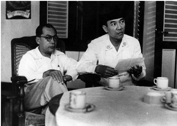
Soekarno en Hatta (Vice President) in een interview met een lokale krant. Ze legde uit wat ze met hun nieuwe Indonesië graag wilden.

Tijdens de Franse Revolutie waren er een aantal belangrijke gebeurtenissen, die ervoor zorgden dat het tij weer werd gekeerd. Terwijl dat in Indonesië met een oorlog moest gebeuren.