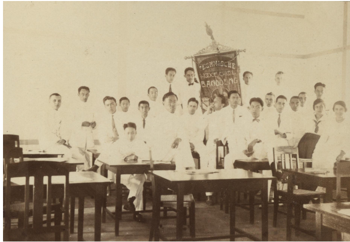
Enkele slimme Indonesiërs die studeren op de Universiteit.

Nederland bouwde wegen, spoorwegen, ziekenhuizen en scholen. Sommige slimme Indonesiërs gingen naar de universiteit. Zij leerden over democratie, vrijheid en gelijkheid. Zij brachten dit aan de Indonesische bevolking over. Die werden steeds meer bewust dat de Nederlanders het niet goed deden.