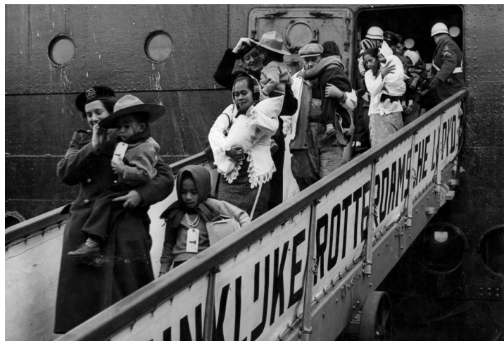
Op 21 maart 1951 kwamen er ongeveer 900 Molukkers met een boot naar Nederland.

Dit is de brief, die de Molukse KNIL soldaten kregen bij aankomst in Nederland. Het is een brief waarin zij te horen kregen dat ze ontslagen waren.