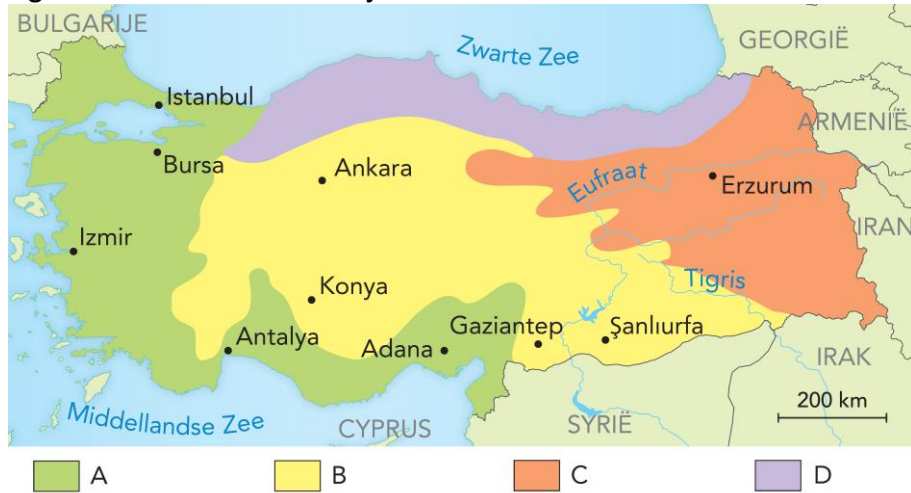
Figuur 6 Klimaten in Turkije.