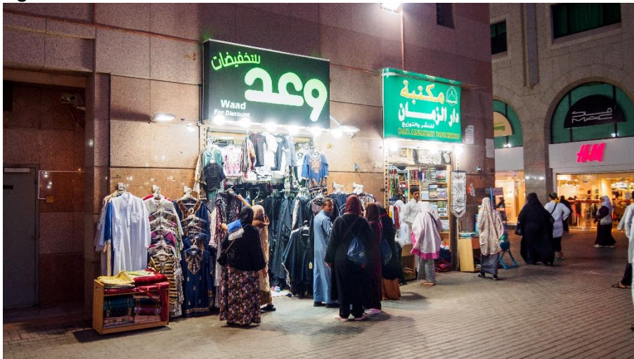
Figuur 4 Een straat in de stad Medina.