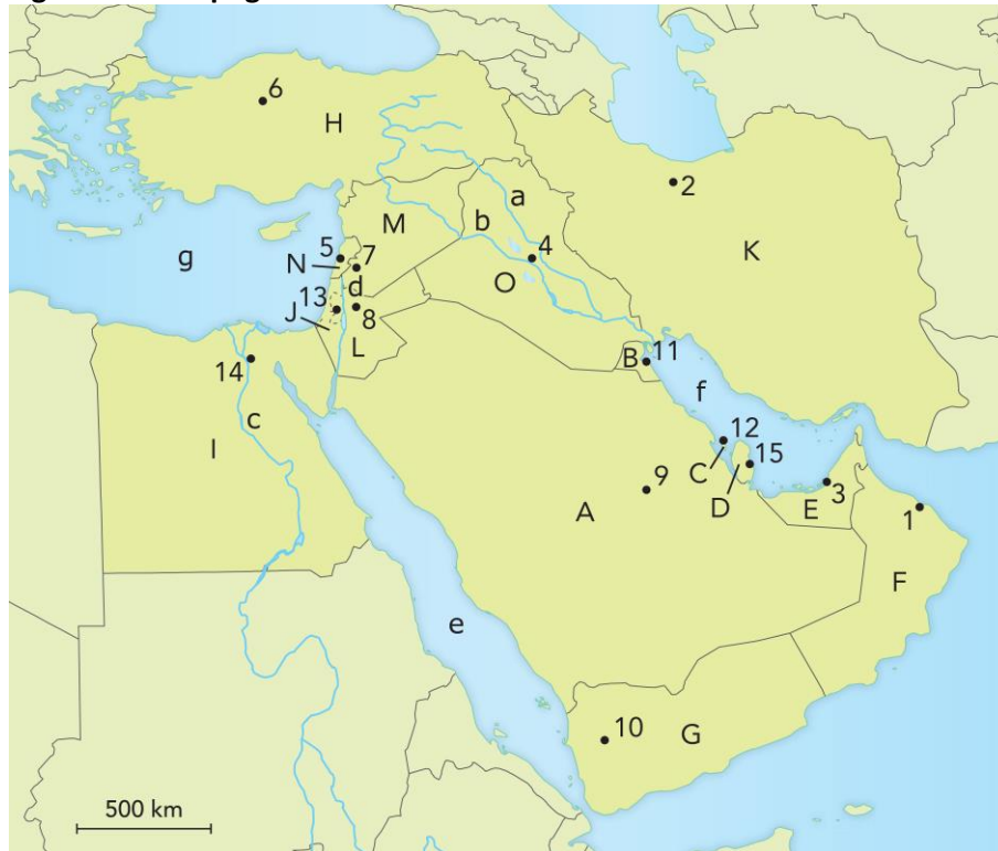
Figuur 5 Topografie van het Midden-Oosten.